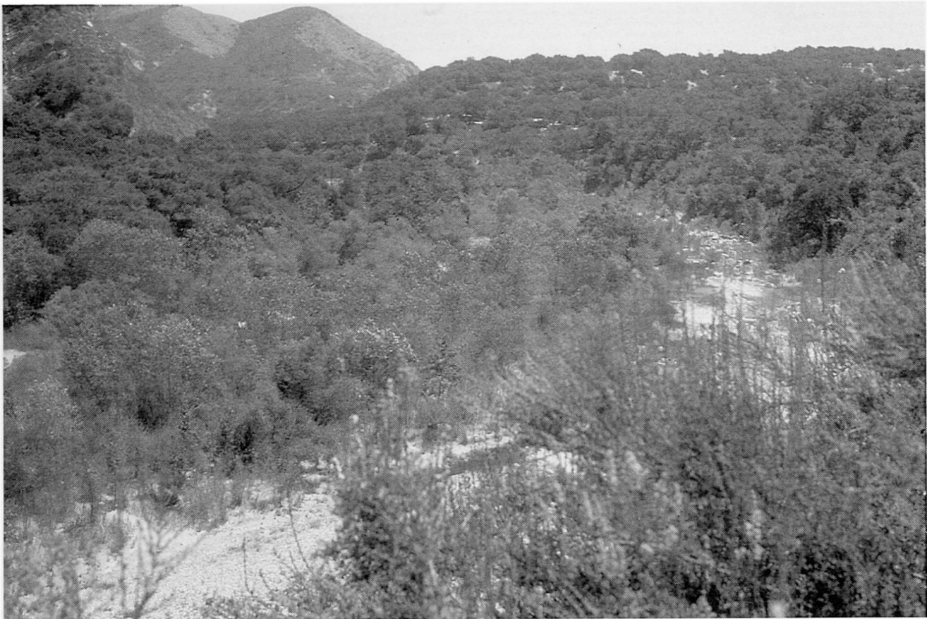
Abb. 2 Typischer Ausschnitt aus dem Untersuchungsgebiet.

arbeiten (Brandbekämpfung, Überwachung der Campingplätze und Wanderwege). Wie sich herausstellte, wohnten zwei der sieben Informanten auch im Untersuchungsgebiet (einfache Wohnwagenunterkünfte). Das Hauptquartier des Forstdienstes befindet sich im Untersuchungsgebiet.