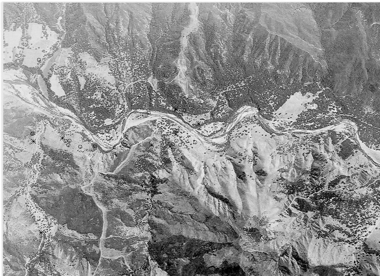
Abb. 4 Umweltwissen einer Informantin, die sich gelegentlich an Wochenenden im Untersuchungsgebiet aufhält (M ca. 1: 20 000; Kreuz = Objekt auf Luftbild klar sichtbar, Kreis = auf Luftbild schwach sichtbar, Stern = auf Luftbild nicht sichtbar).

Insgesamt fiel auf, daß Mitarbeiter des Forstdienstes (Gruppe 2), die einen hohen Berührungsgrad mit dem Untersuchungsgebiet aufweisen, ein viel größeres De-