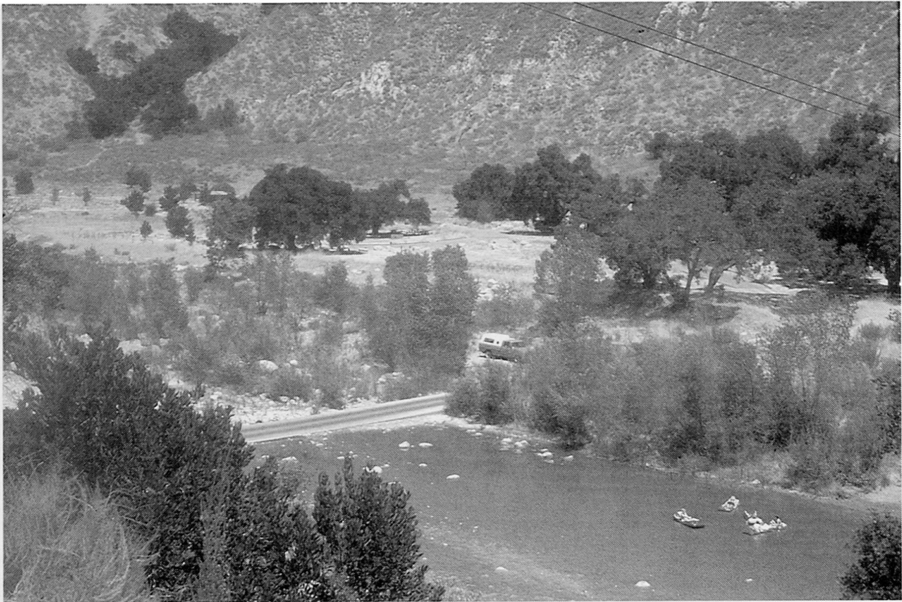
Abb. 3 Campingplatz im Los Padres National Forest.

geometrischen Transformationen von der erlebten Welt zur Perspektive der Luftaufnahme mühelos zu vollziehen.