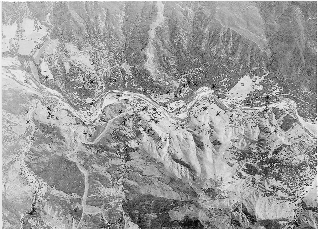
Abb. 5 Umweltwissen eines Informanten, der im Untersuchungsgebiet wohnt und arbeitet (M ca. 1: 20 000; Kreuz = Objekt auf Luftbild klar sichtbar, Kreis = auf Luftbild schwach sichtbar, Stern = auf Luftbild nicht sichtbar).

Demgegenüber war das Umweltwissen eines Informanten aus Gruppe 2, der Mitarbeiter im Forstdienst ist und seit zwei Jahren im Untersuchungsgebiet einen Wohnwagen bewohnt, sowohl räumlich als auch thematisch und bezüglich Detaillierungsgrad ungleich vielfältiger (Abb. 5). Der Informant konnte zahlreiche Informationen zum Beispiel über Bademöglichkeiten im Fluß oder über die Eignung des Gewässers zum Fischen wiedergeben. Zudem kannte er den Standort jedes Abfalleimers, die er wöchentlich einmal zu leeren hatte.