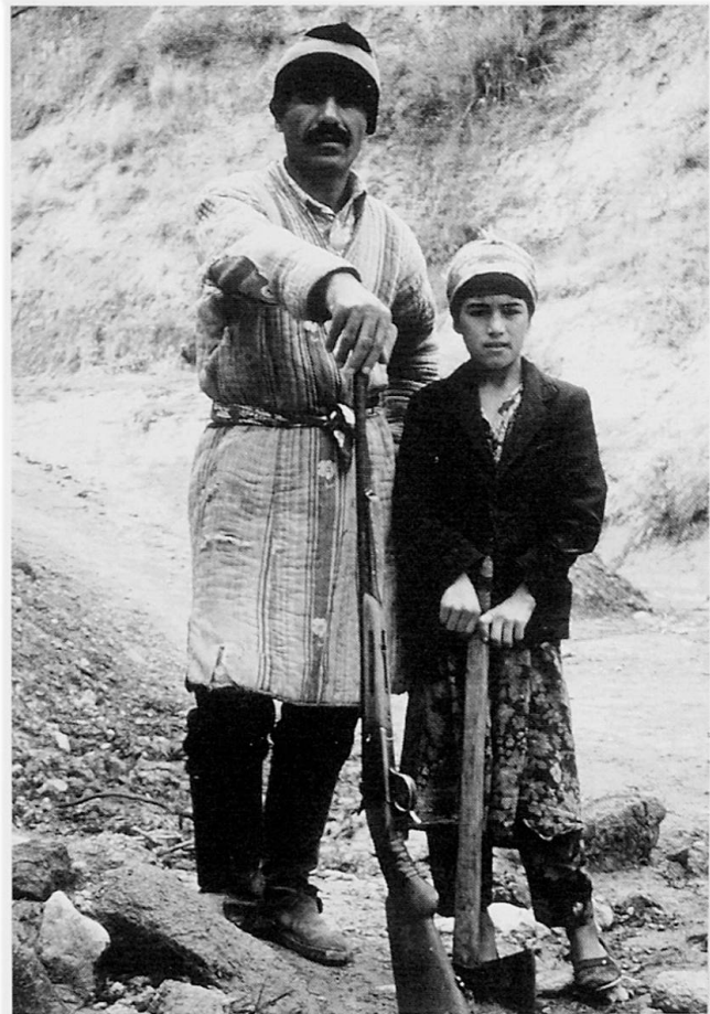
Abb. 4 Jäger mit seiner Tochter. Er ist auf dem Weg in die Berge, um wilde Hühner zu jagen.

Verstärkt wird die Krise der tadschikischen Wirtschaft durch den Exodus von fast 400 000 europäischen Ex-Sowjetbürgern, die mehrheitlich als Fach- und Verwaltungsangestellte tätig waren (NZZ 13.8.1993).