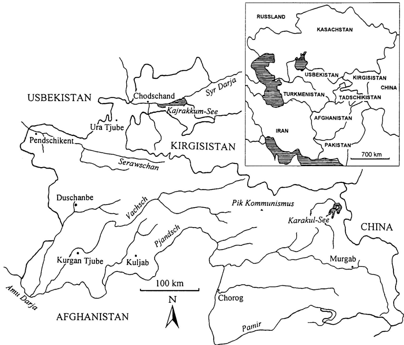
Abb.1 Übersichtskarte von Tadschikistan und Zentralasien.

Der gesamte zentralasiatische Gebirgsraum ist tektonisch noch keineswegs zur Ruhe gekommen. Mehrmals jährlich treten starke Erdbeben und Erdstöße auf (VON MAYDELL 1983). Diese große Erdbebengefahr führt dazu, daß in Duschanbe kaum Hochhäuser errichtet werden. Einstöckige Bauten sind in der Überzahl.