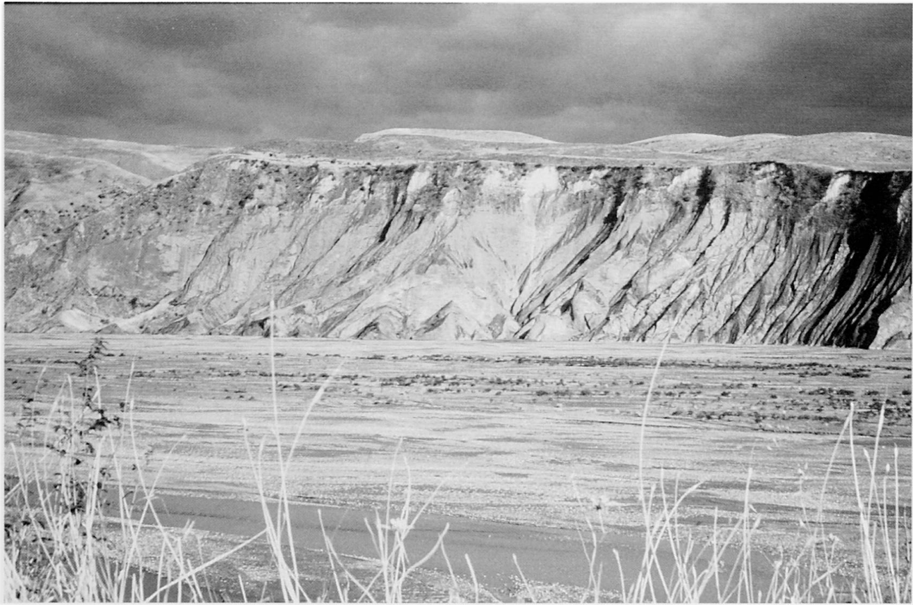
Abb. 2 Kysylsu – ein Fluß im Süden Tadschikistans.

die Türken in die innerasiatischen Steppenregionen ein. Zu Beginn des 8. Jh. n. Chr. stießen arabische Heere nach Zentralasien vor und verbreiteten im ganzen Gebiet eine neue, islamisch geprägte Kultur (MUSEUM RIETBERG 1989).