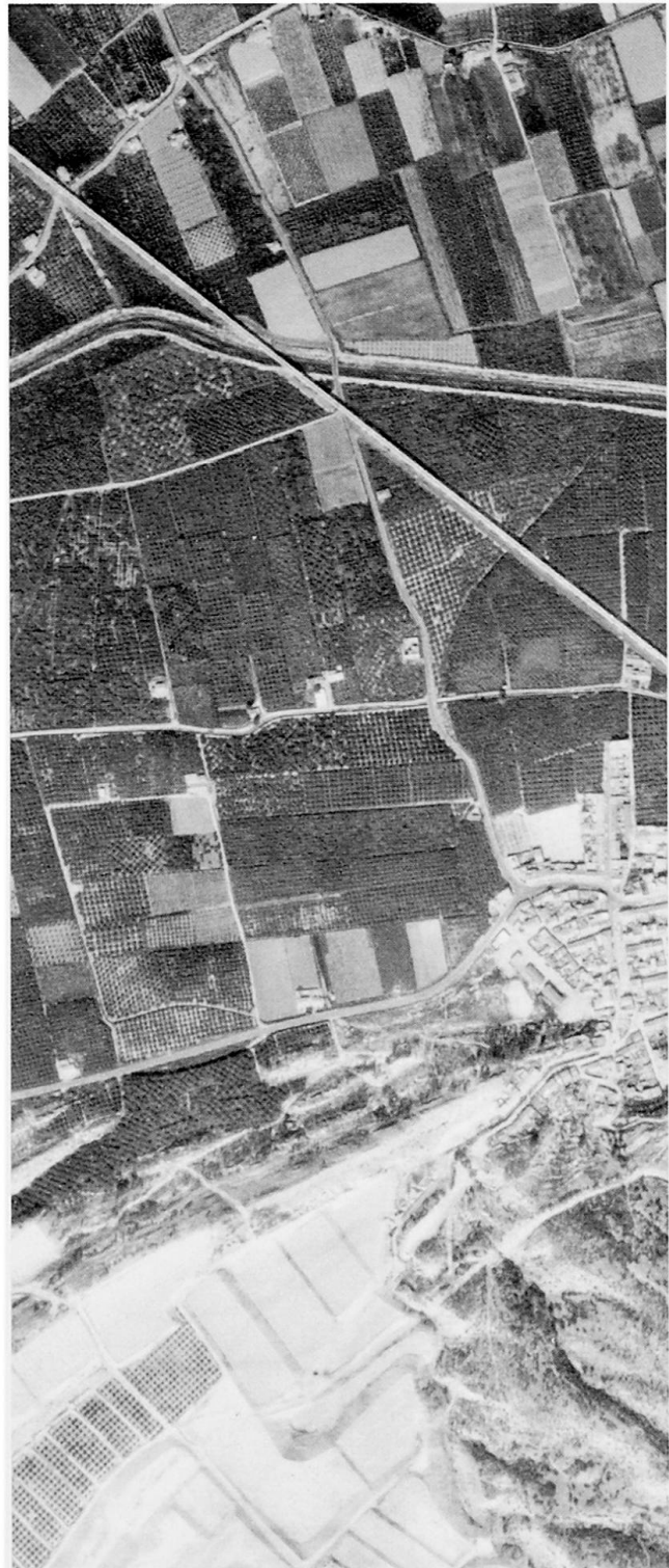
Abb.2 Luftbild entlang der Straße von Arneva nach Orihuela (etwa 1 : 10 000).

TAUBER, W. (1995): Auf Argumente hört in Spanien offenbar niemand. In: «Weltwoche» vom 26. Oktober 1995.