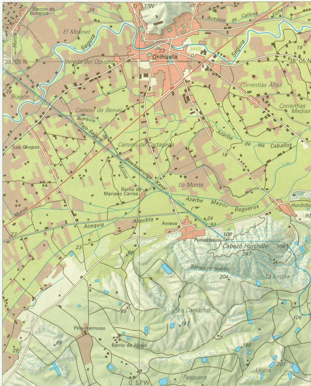
Orihuela 1 : 50 000 Stand 1984

Traditionelle Bewässerung in der Huerta: — Bewässerungskanäle — Zitruskulturen (Zitronen, Orangen)