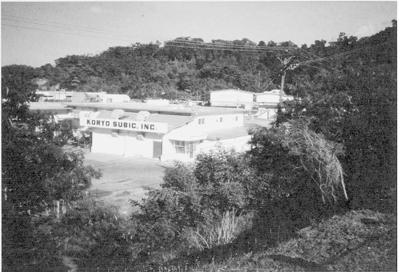
Abb. 2: Nachnutzung ehemaliger militärischer Gebäude in der Subic Bay Freeport Zone

Use of former military buildings in the Subic Bay Freeport Zone