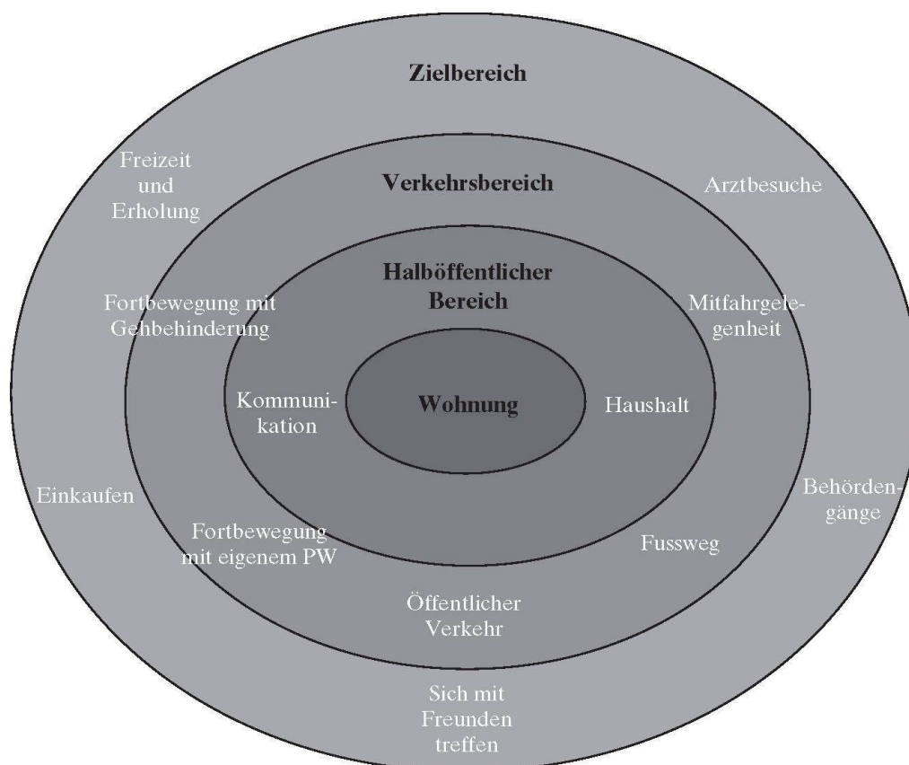
Abb. 2: Räumliches Umfeld im Alter Spatial environment of the elderly Contexte spatial des personnes âgées

Viele alte Menschen wünschen sich eine möglichst aktive und selbständige Nutzung des räumlichen Gefüges (FRIEDRICH 1995: 79), weshalb auch der öffentliche Raum für Betagte selbständig und möglichst gefahrlos zugänglich sein sollte. Ein selbständiges Sich-Zurechtfinden im öffentlichen Raum hängt daher wesentlich von der Nähe zu Infrastruktureinrichtungen wie Einkaufsmöglichkeiten, Ämtern oder öffentlichen Verkehrsmitteln ab. Eine verallgemeinernde Unterstellung von Gebrechlichkeit sollte aber vermieden werden, weil sie einer einseitig das Biologische betonenden Betrachtungsweise Vorschub leistet, auf deren Basis vor allem die Nähe zu Einrichtungen des Gesundheitswesens gefordert wird (LANDOLT 1999: 18). Vermeintliche Standortpräferenzen wie «Ruhe» oder «schöne Aussicht» in den Planungsprozessen öffentlicher wie privatrechtlicher Bauprojekte sind den Erkenntnissen der Altersforschung anzupassen.