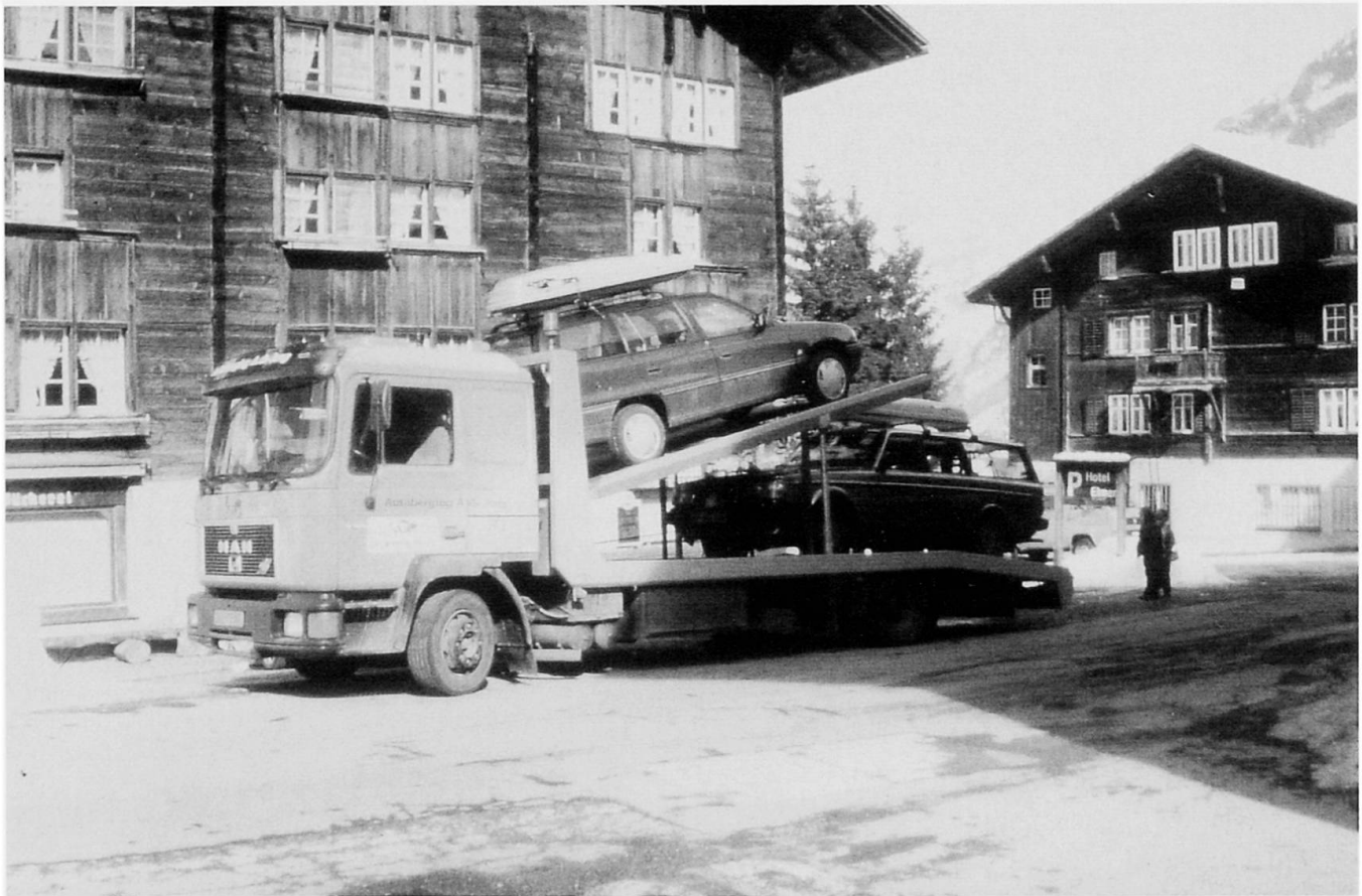
Abb. 2: Rückschaffung von während des Lawinenwinters 1999 in Elm (GL) zurückgelassenen Autos durch einen belgischen Abschleppdienst. Dieses Beispiel zeigt, wie auch weit vom Ereignisort entfernt angesiedelte Unternehmen von den Mehreinnahmen profitieren können, welche ein katastrophales Naturereignis verursacht.

Camion de dépannage belge ramassant des voitures abandonnées pendant les avalanches de l'hiver 1999 à Elm (GL). Cet exemple montre que même des entreprises situées très loin du lieu d'une catastrophe naturelle peuvent profiter des recettes supplémentaires causées par cet évènement.