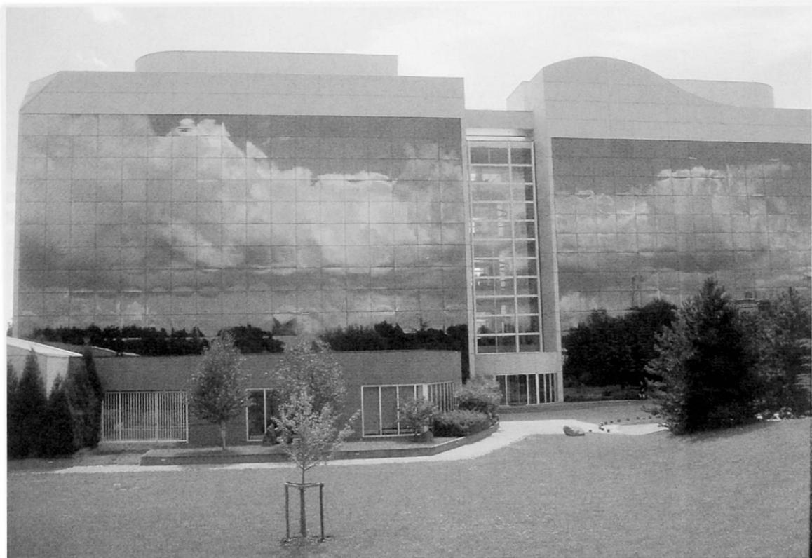
Foto 2: Institut de Génétique et de Biologie Moléculaire et Cellulaire (IGBMC), Illkirch-Graffenstaden Institute of Genetics and Molecular and Cellular Biology, Illkirch-Graffenstaden