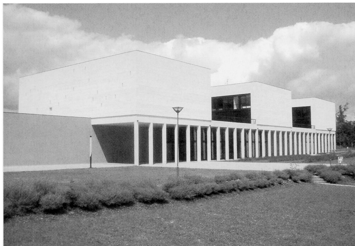
Fotos 3 und 4: International Space University (ISU), Illkirch-Graffenstaden Fotos: J. WENDEL