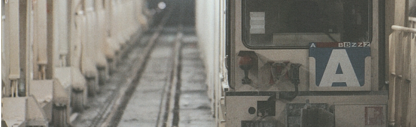
Foto sopra e sotto a destra: prima di effettuare ogni movimento, i treni di cantiere devono ricevere l'autorizzazione dalla centrale di comando.