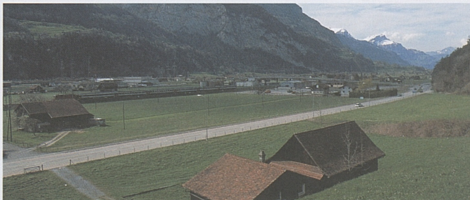
Der Baubeginn im Raum Erstfeld ist für die Eröffnung der neuen Gotthardbahn von zentraler Bedeutung.

Im März 2004 erteilte das Eidgenössische Departement für Umwelt, Verkehr, Energie und Kommunikation (UVEK) der AlpTransit Gotthard AG die Baubewilligung für den Abschnitt Erstfeld des Gotthard-Basistunnels. Die ATG hat in der Zwischenzeit die von Bundesrat Moritz Leuenberger unterzeichnete Plangenehmigungsverfügung für das NEAT-Auflageprojekt Uri 2003 analysiert und weitere Schritte in die Wege geleitet. Als Folge der Verfügung sind verschiedene Projektänderungen notwendig. Unter anderem: eine vierspurige Überholgleisanlage, die Verlegung der Materialzwischenlager Erstfeld vom Rynächt in den Bereich Chalchofen, zusätzliche Materialzwischenlager und ein kombinierter Rad- und Gehweg entlang des Walenbrunnens. Wenn alles rund läuft, werden im Sommer 2004 im Raum Erstfeld die Arbeiten aufgenommen.