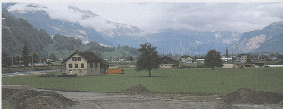
Das Besucherzentrum Erstfeld wird nördlich des A2-Autobahnzubringers erstellt.

Nördlich vom A2-Autobahnzubringer erstellt die AlpTransit Gotthard AG für die Zeit bis zur Inbetriebnahme des Gotthard-Basistunnels ein attraktives Informations- und Besucherzentrum. Auf einer Fläche von rund 400 m 2 werden sich der Kanton Uri und die ATG präsentieren. Die Ausstellung wird dem Bau des längsten Eisenbahntunnels der Welt gewidmet sein und zeigt Themen des Tunnelbaus. Der Kanton Uri hat Gelegenheit, sich innerhalb dieser Ausstellung mit einem attraktiven Auftritt zu profilieren. Ergänzend dazu können die Besucher/-innen über eine Passerelle und einen Baustellenweg die NEAT-Grossbaustelle Erstfeld zu Fuss erkunden oder in geführten Gruppen einen Informationsrundgang unter Tag absolvieren. Das Besucherzentrum in Erstfeld wird von der AlpTransit Gotthard AG erstellt und betrieben. Der Beginn der Bauarbeiten für das Besucherzentrum ist Ende 2005, die Eröffnung Mitte 2006 vorgesehen.