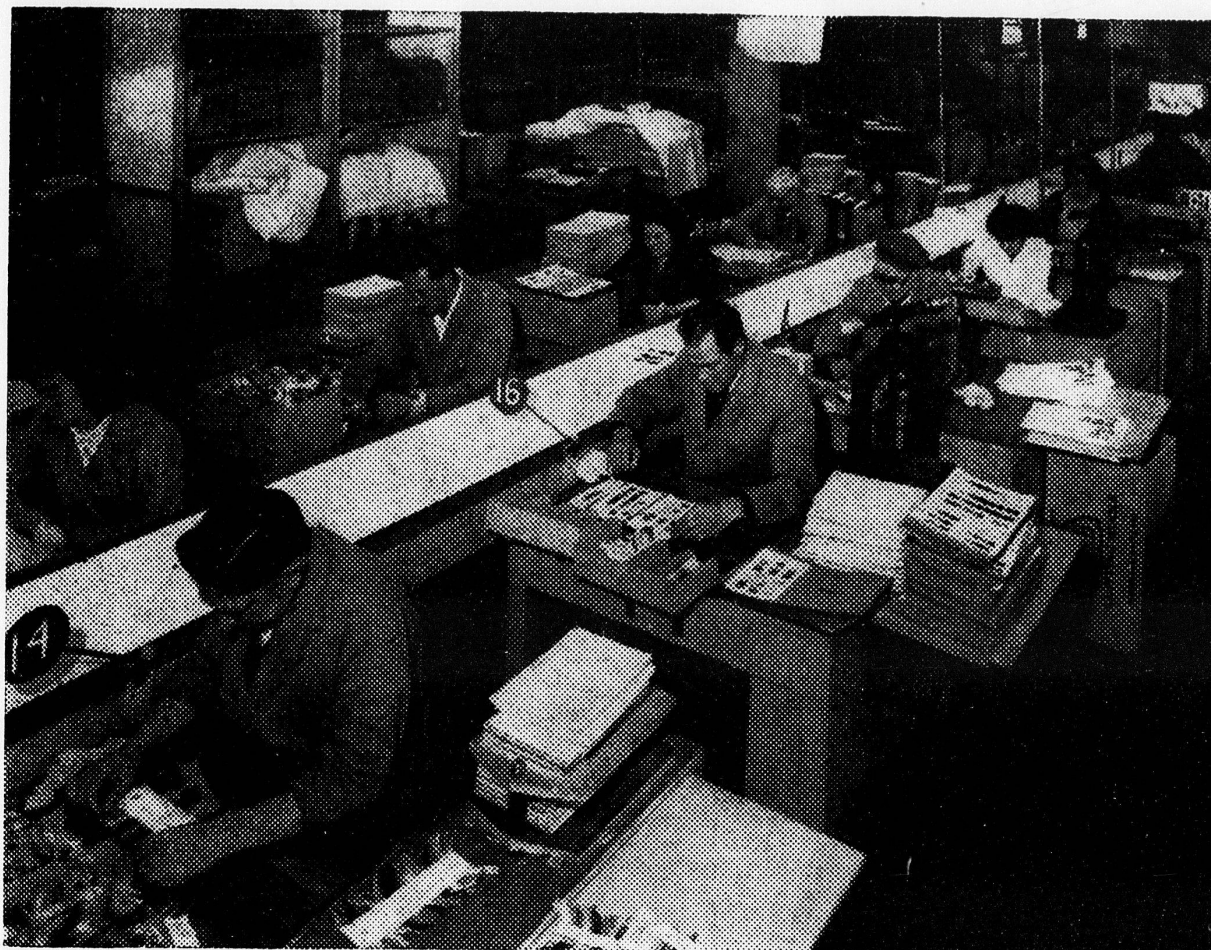
Herstellung von Musterkarten für gefärbte Schafwolle Zusammenarbeit mit Firma der Privatindustrie

und hat die Zahl der aufgenommenen multilateralen Stipendiaten nahezu erreicht. Diese Stipendiaten kamen aus folgenden Kontinenten: