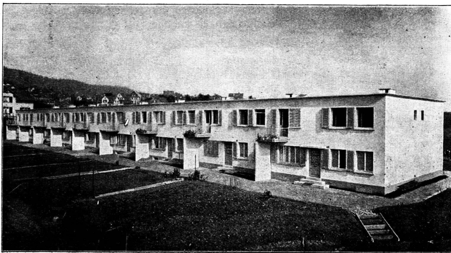
Vue d'une des façades. Sur le toit à remarquer les ventilations.

Les entrées sont protégées par un balcon; les murs sous les balcons isolent chaque maison.