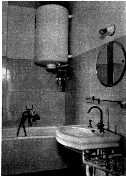
Chauffe - eau électrique de 75 litres. (forme raccourcie)

Le chauffe-eau électrique permet de moderniser vos chambres de bain • L'électricité est le moyen de production d'eau chaude le plus économique.