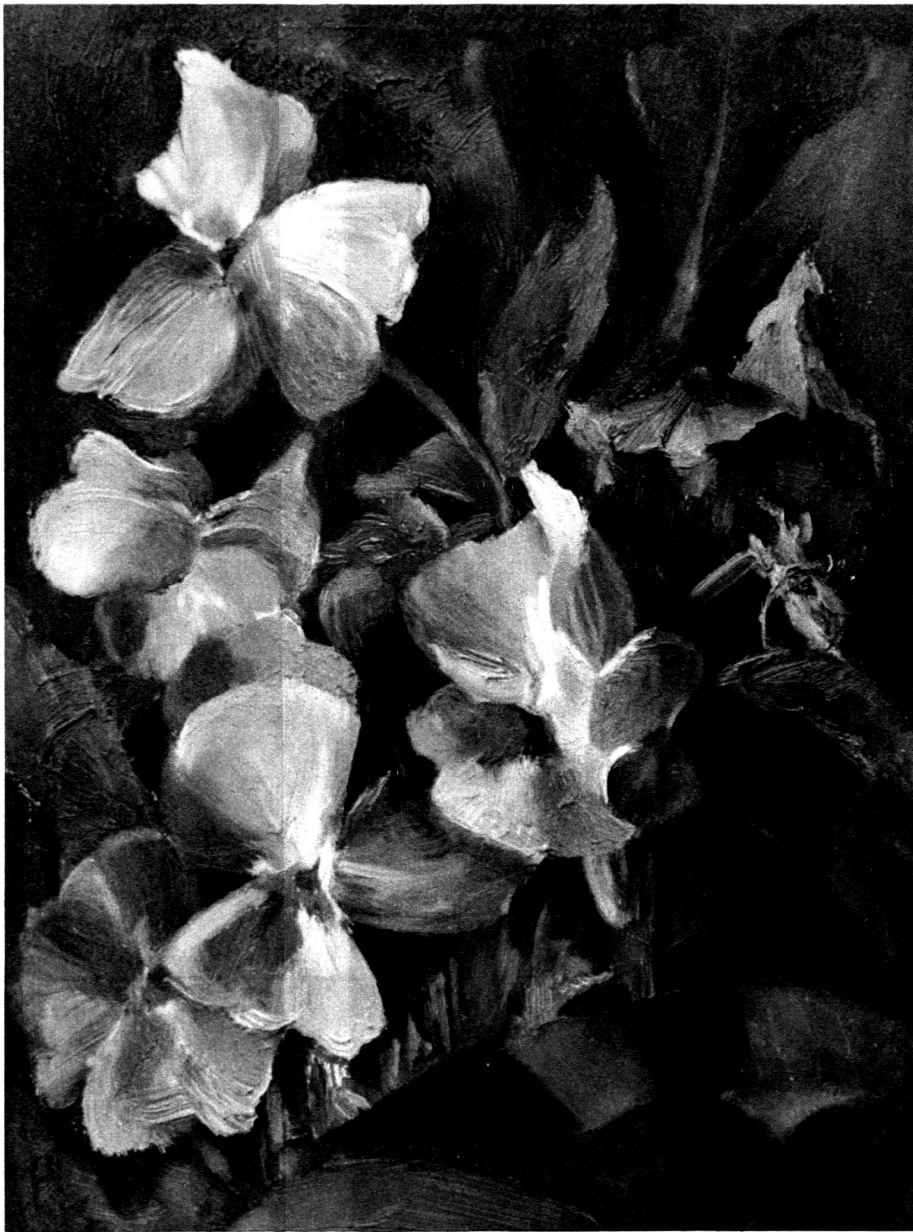
Pensées blanches, huile (1936)