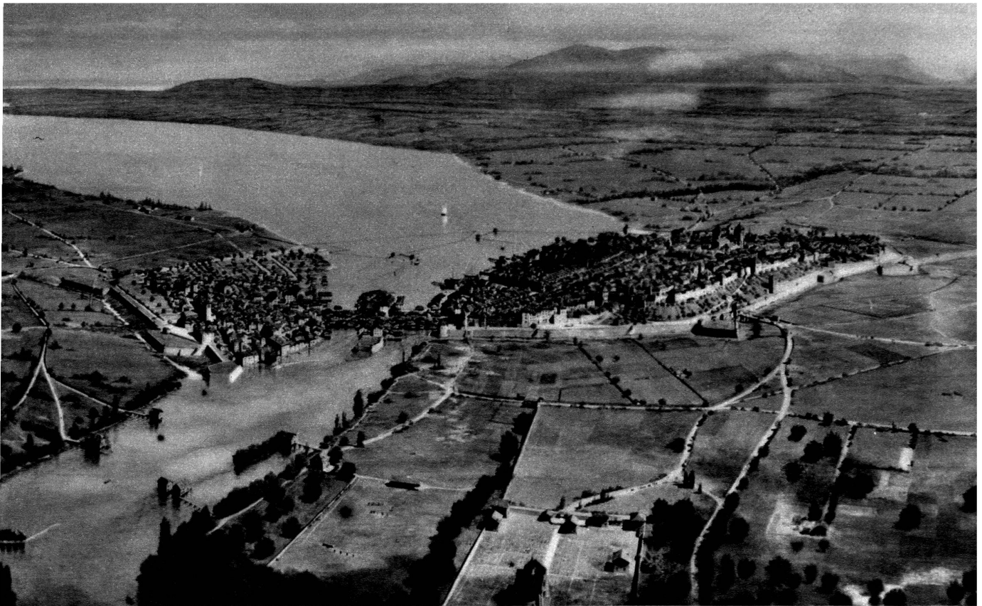
Genève en 1600, d'après une perspective établie par Ziegler. Type de la ville surpeuplée à la fin du moyen âge