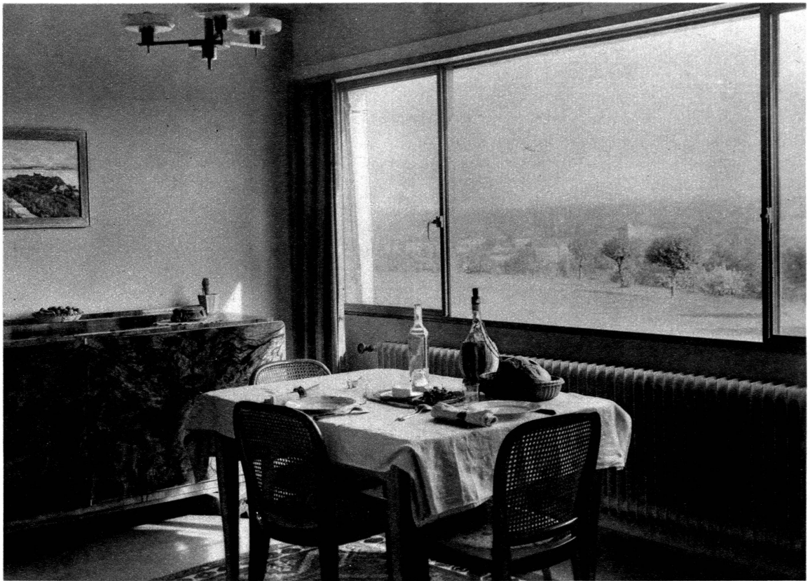
Maison locative à Tivoli.

Grande baie métallique en quatre parties, dont deux coulissantes et deux fixes.