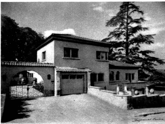
Vue de l'entrée.

La villa de M. P. V., industriel, fait partie d'un groupe de maisons luxueuses situées dans l'ancien domaine de Plongeon, sur la rive droite du lac, à proximité du centre de la ville.