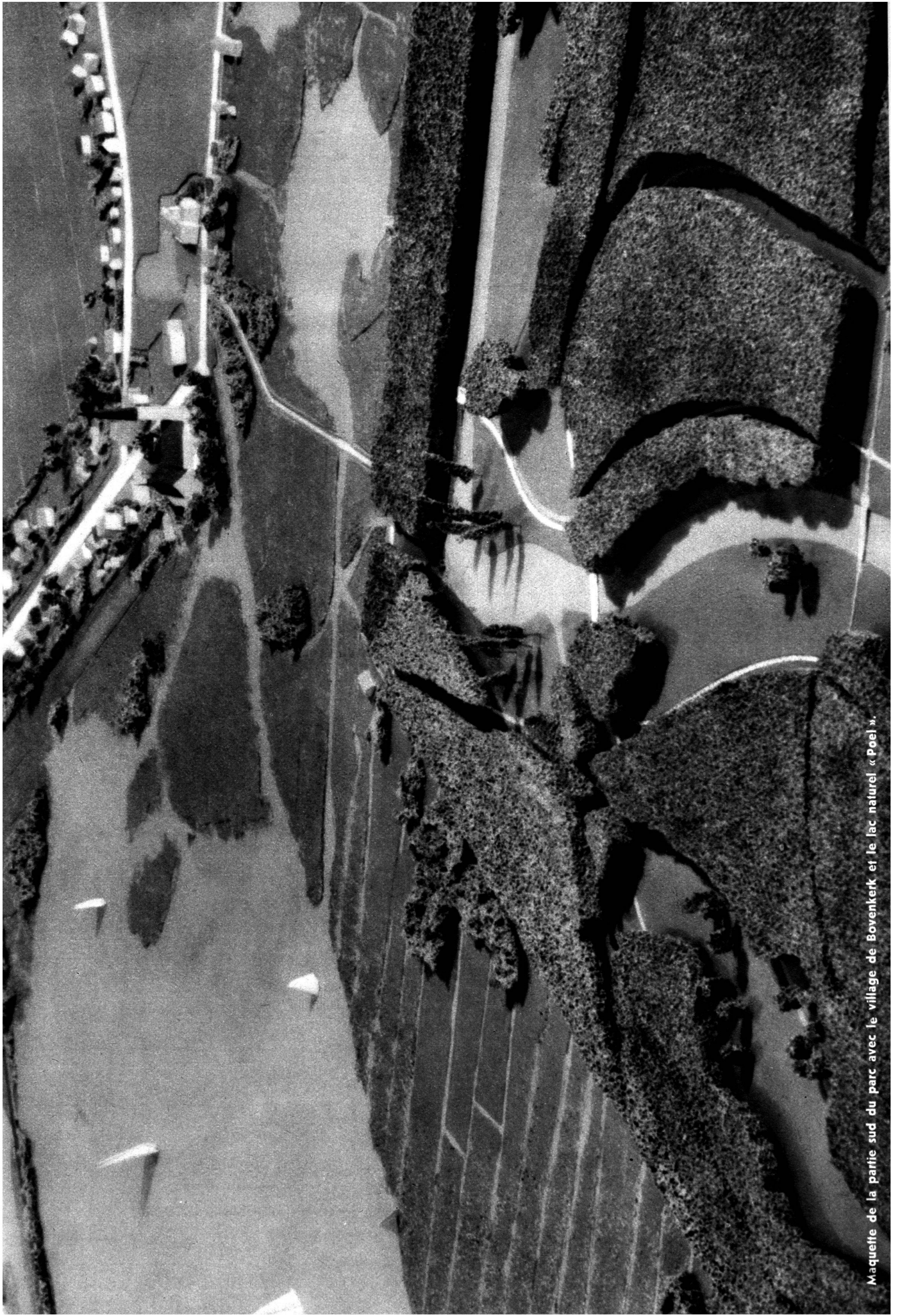
Maquette de la partie sud du parc avec le village de Bovenkerk et le lac naturel « Poel ».