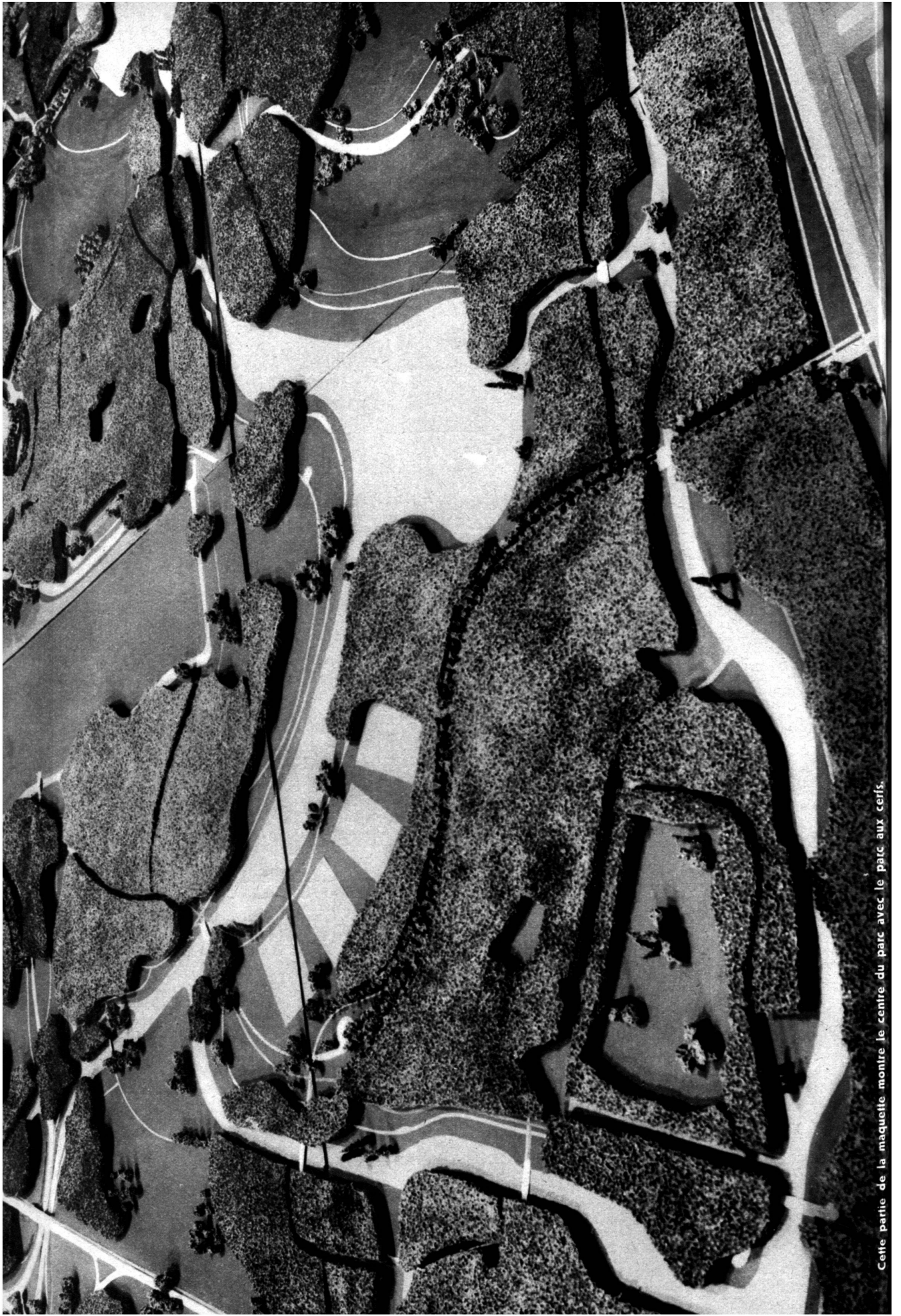
Cette partie de la maquette montre le centre du parc avec le parc aux cerfs.