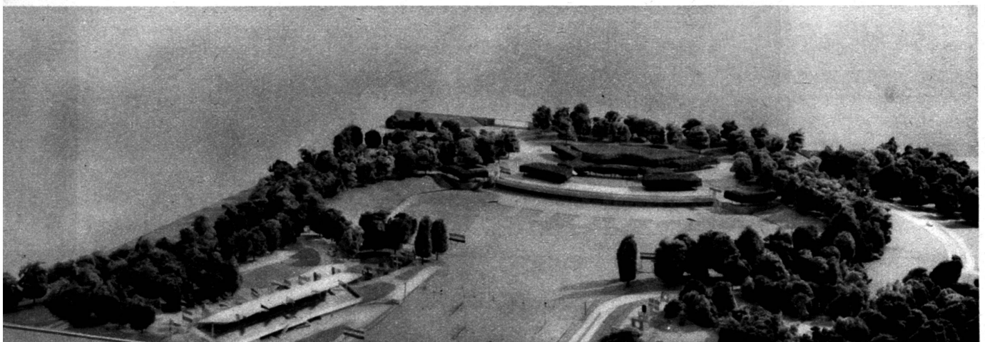
Vue générale montrant : au fond, l'entrée principale ; au premier plan, l'arrivée des régates et, au centre, les garages pour bateaux de course à l'aviron.