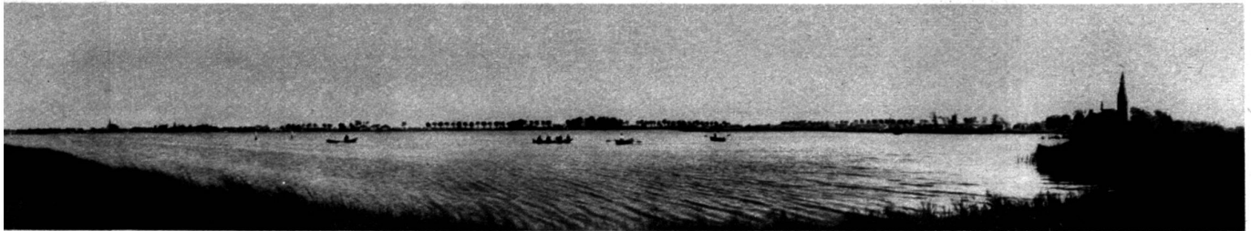
Paysage actuel dans le sud du parc projeté. Le lac naturel « De Poel ».