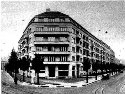
Immeuble de rapport à Zurich, équipé avec la robinetterie antibruit Elysium.

ou d'une chasse d'eau venant se greffer tout à coup sur une conversation ou perturber quelque audition radiophonique.