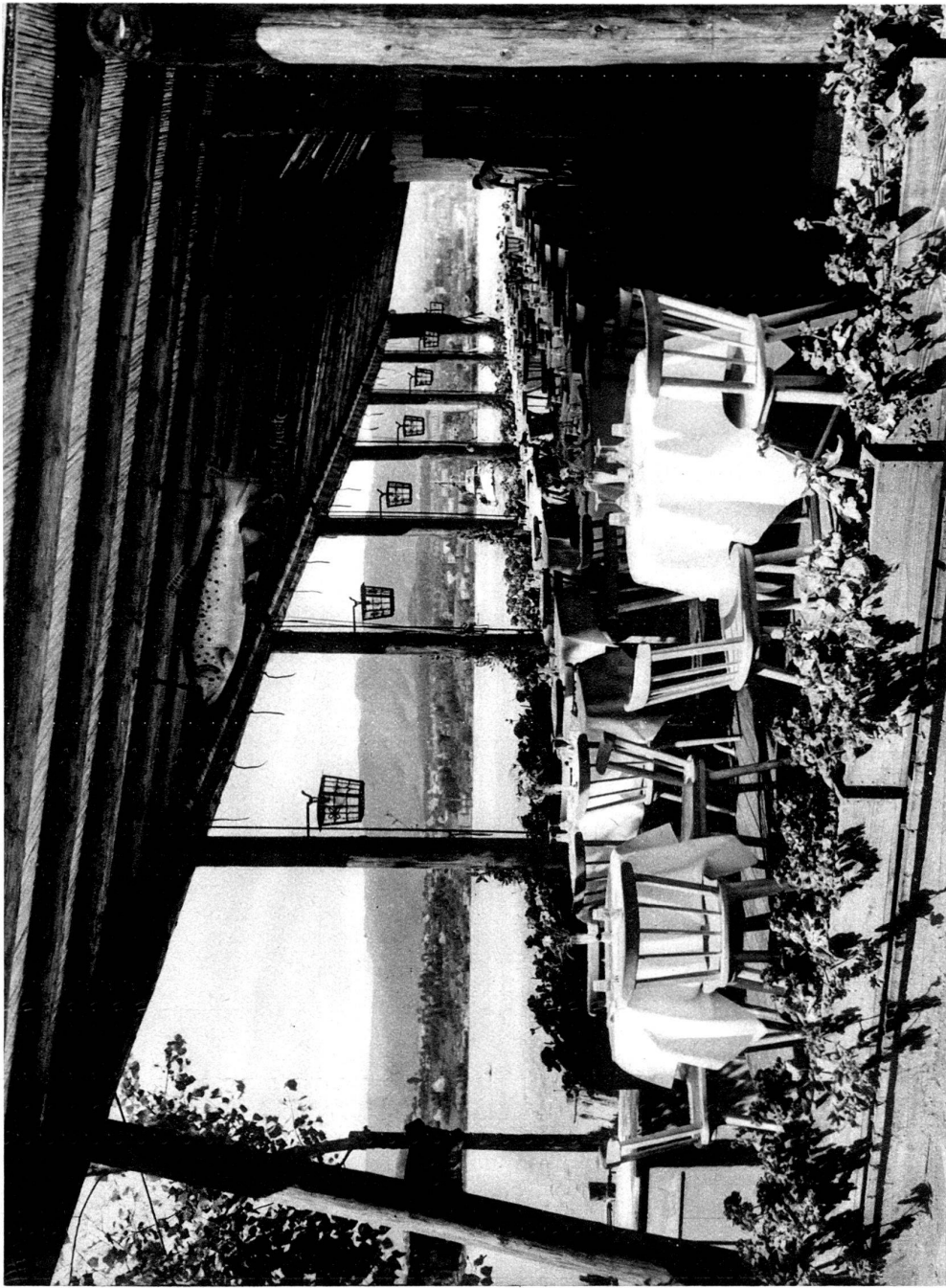
Vue intérieure du Restaurant des Pêcheurs