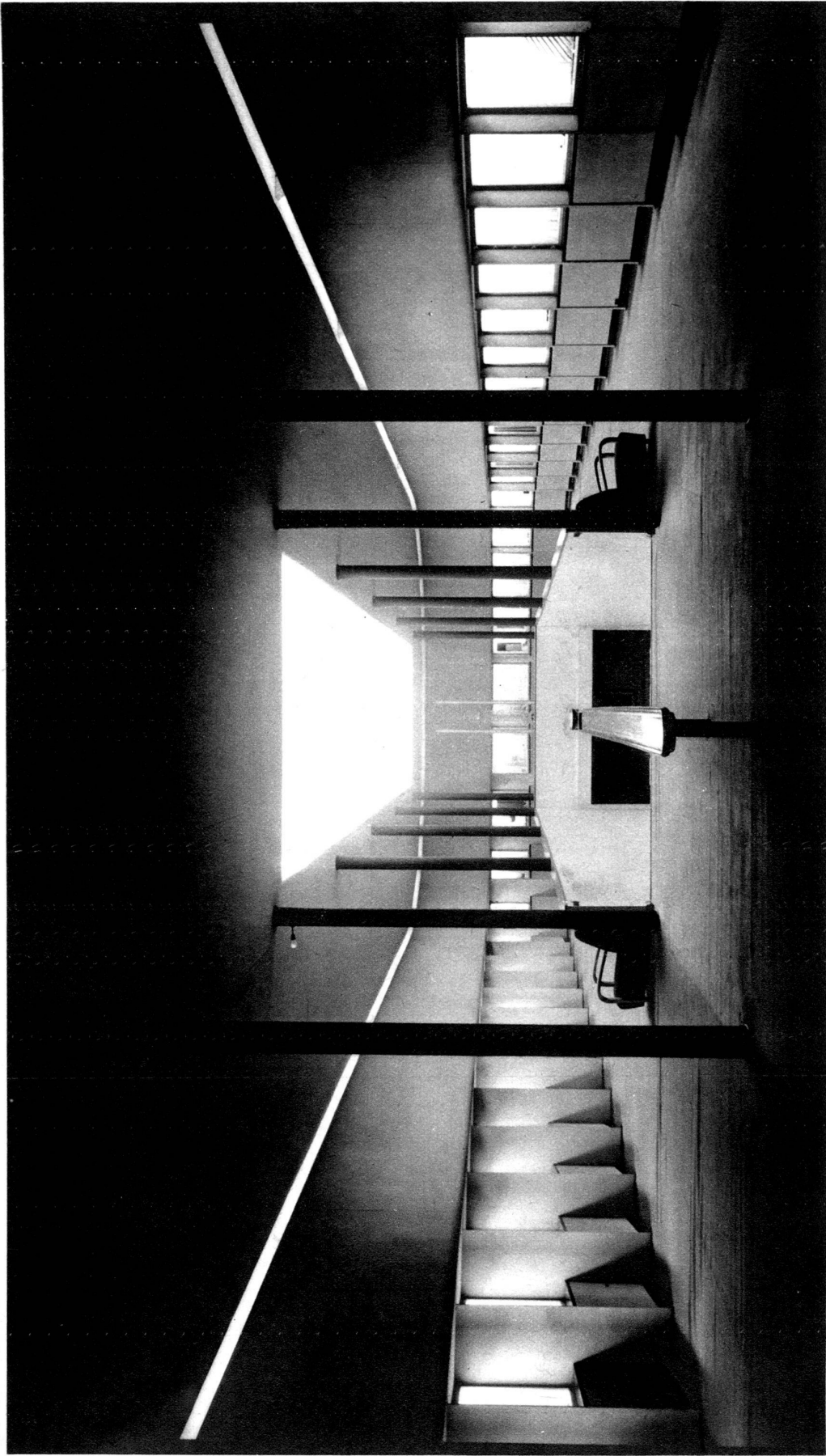
L'intérieur du Pavillon de l'horlogerie. A. Guyonnet, arch. FAS, Genève.