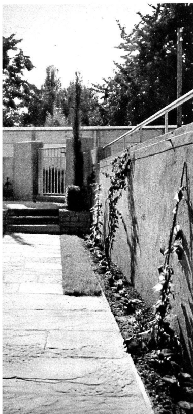
Entrée d'immeuble locatif.