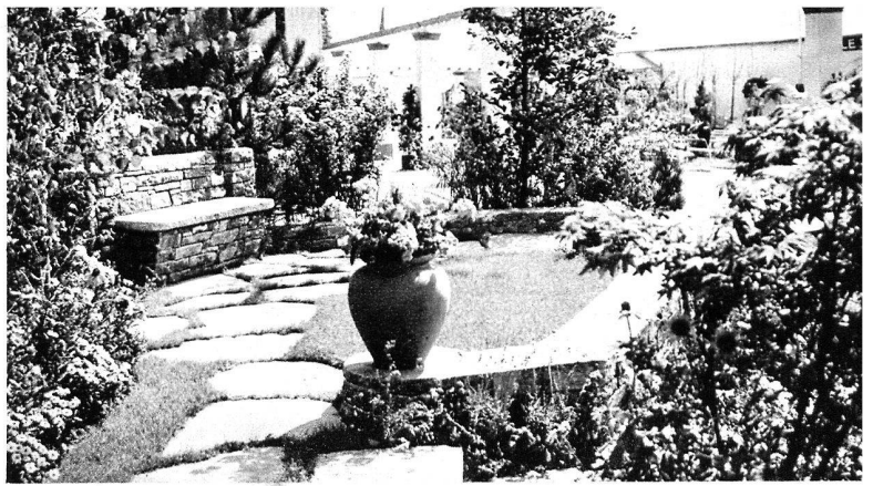
Comptoir suisse 1940.