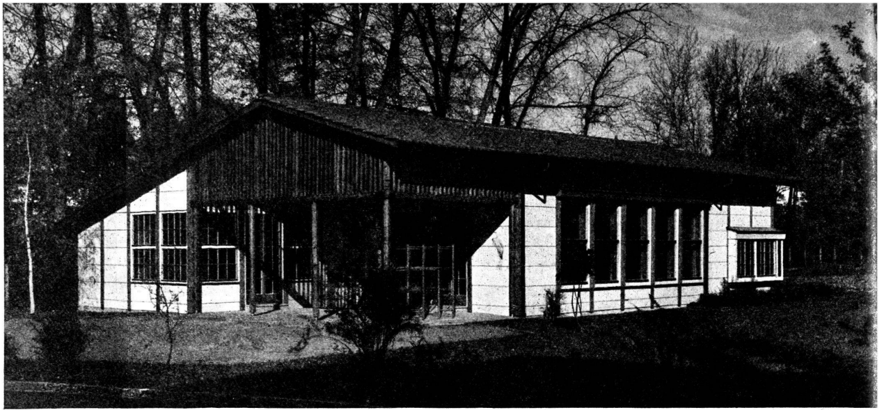
Ecole enfantine à Egelsee. H. Daxelhofer et K. Müller, architectes. Ce bâtiment, construit selon un procédé très récent, le système de plaques de béton sur structure de bois « Durisol », s'adapte parfaitement au paysage.

craindre d'affirmer, histoire, géographie, ethnographie, esthétique et économie à l'appui (je m'excuse d'invoquer de si lourdes références), qu'elle est sujette à caution.