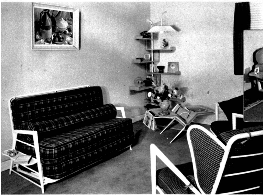
Canapé transformable en lit. J. Hiier, décorateur.