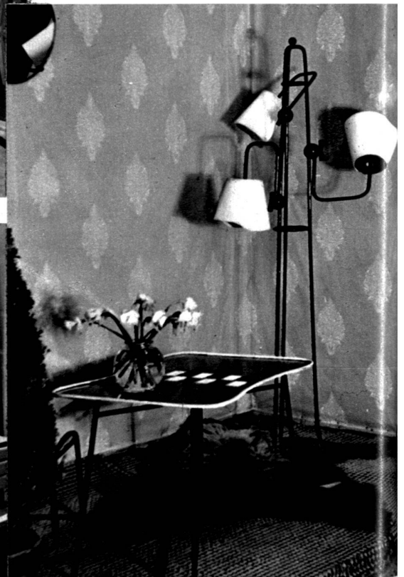
Lampadaire et table métallique de Janette Laverrière