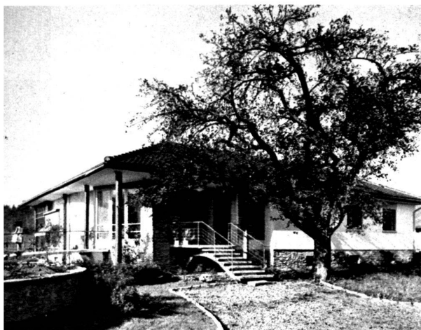
Le petit pont, vu de la galerie-salle à manger.