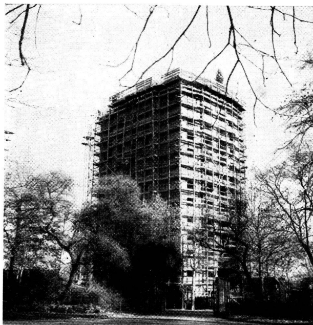
Vue du bloc central, depuis le Kannenfeld-Gottesacker.