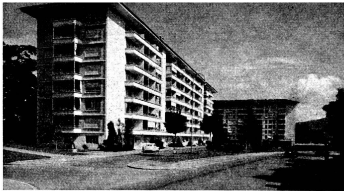
Groupe de Beaulieu. Immeuble « Graphis II », 1950, Fr. Jenny, arch. et Honegger, frères, ing. et arch., au fond l'immeuble de « Graphis I ».

Projet d'aménagement des terrains de fortifications de Genève, Département des Travaux publics, approuvé en 1854.