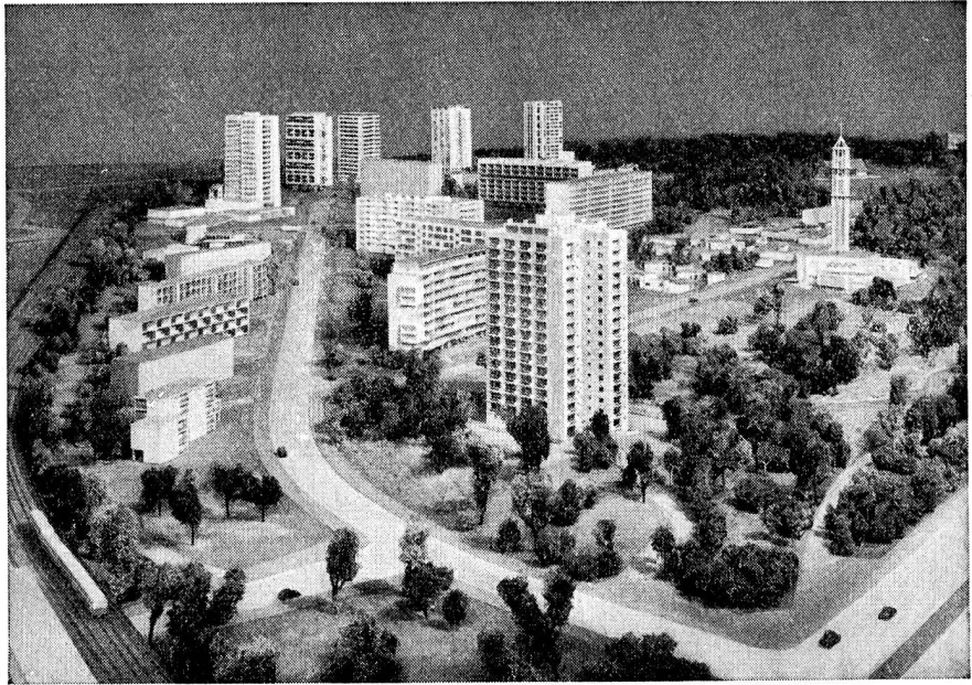
Détail montrant le sud du quartier Hansa, vu du sud-ouest.