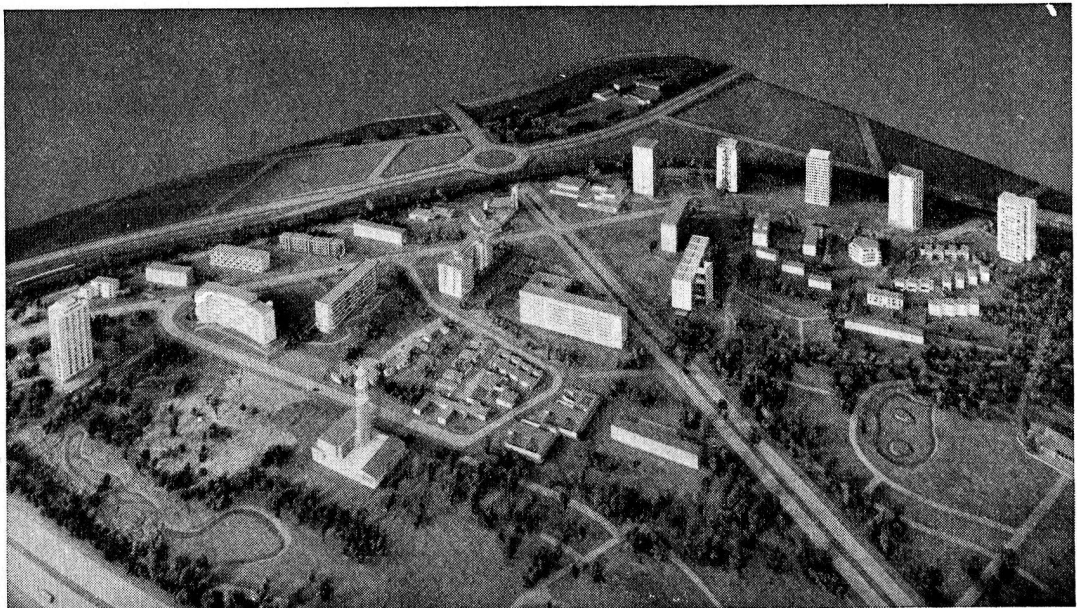
Maquette montrant la partie sud du quartier Hansa, vue depuis le sud-ouest.