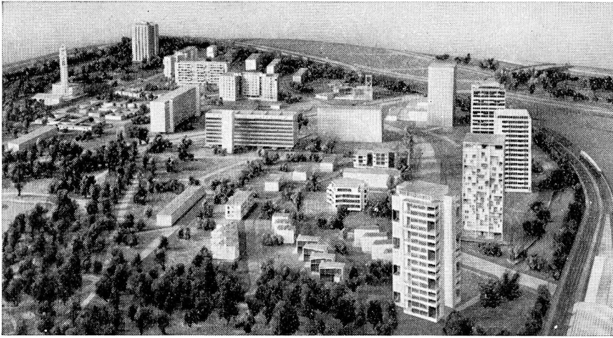
Maquette montrant la partie sud du quartier Hansa, vue de l'est.