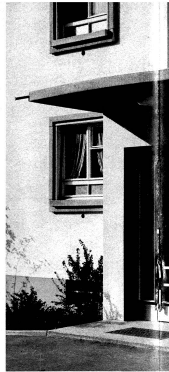
Entrée d'un immeuble