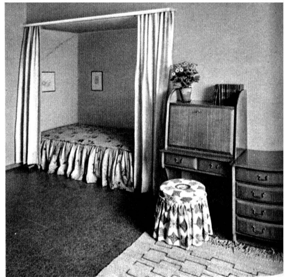
Chambre à un lit