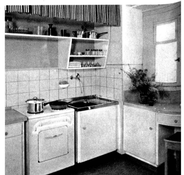
Cuisine d'un logement