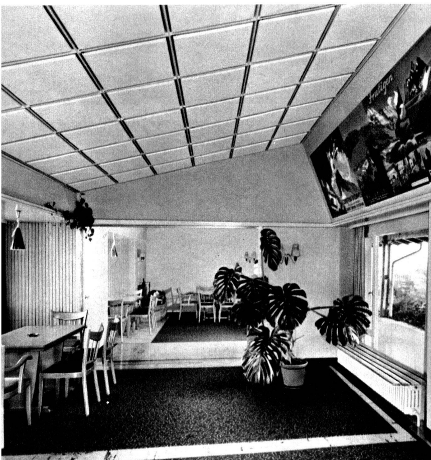
◀ Salle commune