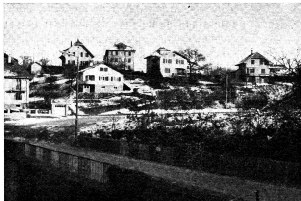
Les causes justes: bienfaits de la libre disposition du sol (Penthelaz, Vaud).

Regardons ainsi le droit de superficie, dont le but premier est d'entourer le superficiaire de garanties supplémentaires quant au paiement de la rente par le superficiaire. Une fois ôtée cette enveloppe qui, semble-t-il, a sa source dans l'équité pure et simple, on voit que le mobile ayant déterminé la loi est d'assurer la protection non pas des particuliers mais bien des communes, qui pourront s'avancer avec moins de crainte dans la voie d'acquisitions accrues de terrains, tout en ne laissant aux personnes privées que le droit de construire des immeubles