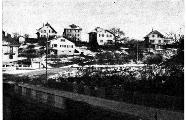
Les causes justes: bienfaits de la libre disposition du sol (Penthelaz, Vaud).

Regardons ainsi le droit de superficie, dont le but premier est d'entourer le superficiaire de garanties supplémentaires quant au paiement de la rente par le superficiaire. Une fois ôtée cette enveloppe qui, semble-t-il, a sa source dans l'équité pure et simple, on voit que le mobile ayant déterminé la loi est d'assurer la protection non pas des particuliers mais bien des communes, qui pourront s'avancer avec moins de crainte dans la voie d'acquisitions accrues de terrains, tout en ne laissant aux personnes privées que le droit de construire des immeubles