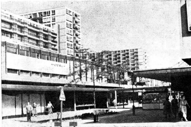
« Un mal qui s'étend comme un cancer... » Au lecteur d'en juger: une réalisation communautaire à Rotterdam... « Grand est l'égarément ! »

Nous pensons qu'il n'est jamais mauvais de connaître les arguments de ceux qui préconisent d'autres solutions que les nôtres. Nous avons extrait du Bulletin immobilier, organe de la Fédération romande immobilière, les lignes inquiètes que voici. Pour les rendre plus frappantes, nous les avons illustrées. (Réd.)