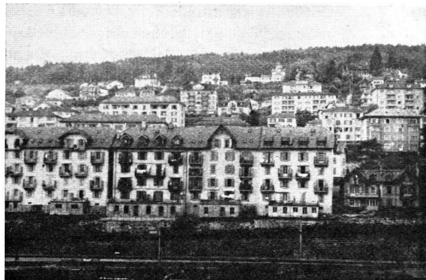
Heureusement, la propriété immobilière en Suisse est encore loin de sa ruine (Neuchâtel).

propriété foncière, qui l'obèrent au point de la rendre peu à peu invivable, c'est-à-dire qui auront pour effet de la ronger à la manière des termites, que ce soit par un nouveau système fiscal qui augmente les divers impôts, que ce soit par la création de nouvelles charges.