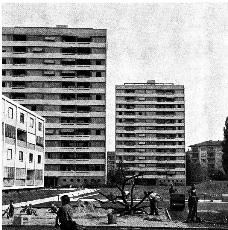
Berne: Tours «Altwyler». Architectes: Helfer, Wirz, Somazzi.

sont interdits. Les locataires le font sans difficulté puisqu'ils peuvent utiliser l'ascenseur, mais il y a du vent devant la maison qui emporte les matières trop légères. Certaines femmes désirent expressément des dévaloirs. Celles d'entre elles qui en ont en sont satisfaites, mais désirent quelques améliorations. Dans la plupart des maisons, le dévaloir est placé sur le palier, devant l'appartement, ce que l'on estime correct. Dans l'un des immeubles, il est aménagé sur une terrasse, ce qui est critiqué à cause des odeurs. Les locataires disent, pour la plupart, qu'elles ont une poubelle supplémentaire qu'elles aimeraient pouvoir vider à la cave sans utiliser le dévaloir. Il serait bon (cela est une suggestion) que le bailleur mette à la disposition des locataires des sacs de papier pour y introduire les détritiques de toute sorte. Le système des dévaloirs est particulièrement désagréable pour le concierge, vu les restes peu appétissants qu'il y trouve.