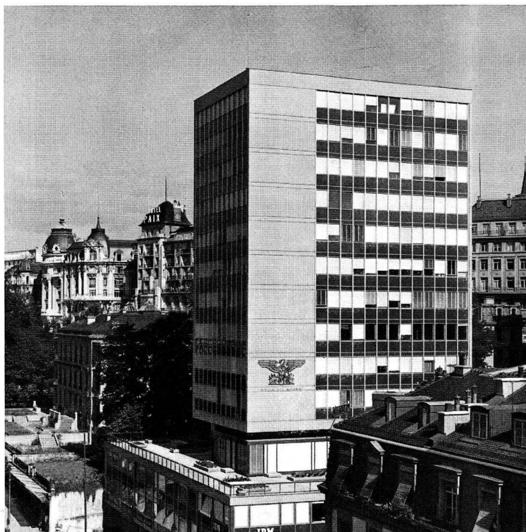
Lausanne: Tour de Georgette.

Il diminue évidemment avec la hauteur. Les bruits gênants, comme les pétarades des motocyclettes, les claquements des portes de voitures, les aboiements de chiens, les bruits des bidons de lait, des poubelles, etc. ne sont pas entendus au haut de l'immeuble. Aucun bruit intense n'existe. La seule chose qu'on entende est le bruit de la place de jeux des enfants.