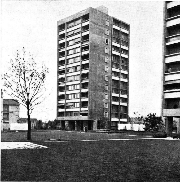
Berne: Tours du Neuhaus à Bümplitz. Architecte: Helfer.

Les immeubles paraissent écrasants parce qu'ils sont aussi larges que hauts.