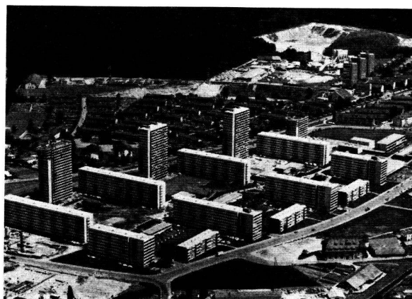
Vue d'ensemble du «Tscharnergut»

Nous passons par les différents ateliers de loisirs. Ce sont ceux que l'Hyspa, il y a quelques années, a exposés à Berne. Ils ont été replantés au «Tscharnergut». Il y a une forge, une menuiserie, un atelier de bricolage, un atelier de réparation de radio. Comme c'est mercredi