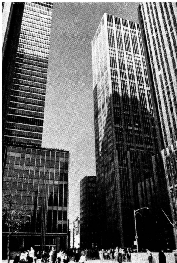
La 5 e Avenue.

briques qui rappellent beaucoup celles de Londres, souvent avec quelques marches pour arriver à la porte d'entrée peinte en vert ou quelquefois en rouge, bardées à l'extérieur d'échelles de fer en zigzag, autrement dit d'escaliers de secours en cas d'incendie. Dans ces maisons, pas d'ascenseur, pas d'air conditionné, pas de dévaloir. Chacun, en sortant au cours de la journée, s'arrange à jeter les débris du ménage dans de grosses poubelles, déposées en retrait sur le trottoir. Les couloirs de ces maisons, construites, j'imagine, à la fin du siècle dernier, sont étroits, si bien qu'il n'y a pas moyen d'y loger une poussette d'enfant. Si vous avez beaucoup de chance, vous trouverez pour 40 ou 50 francs par mois, une