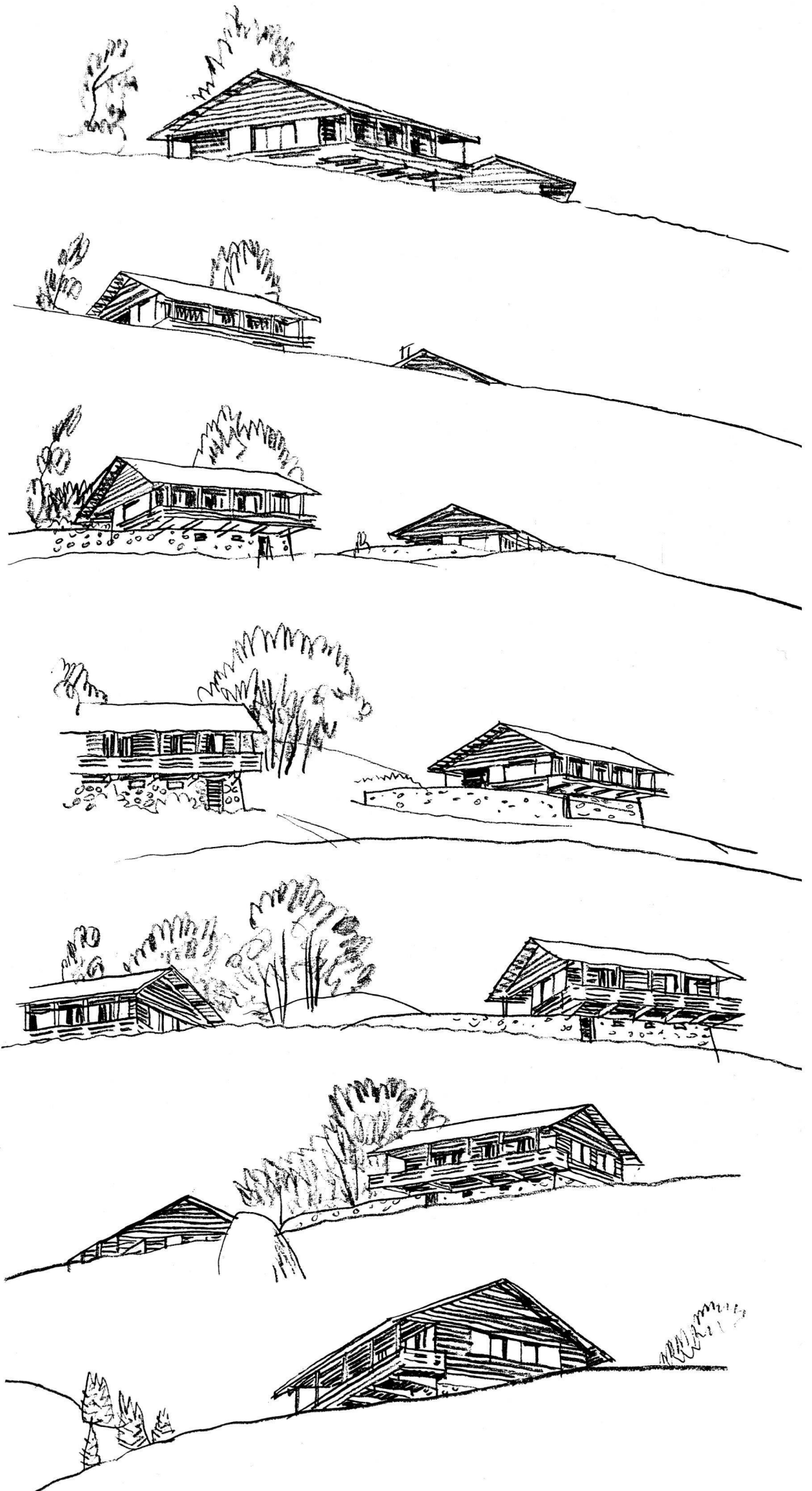
Voyage autour de deux chalets