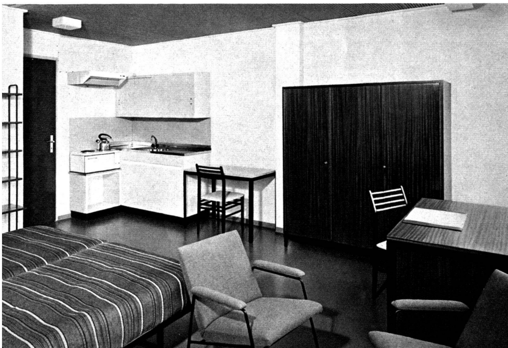
Chambre à deux lits