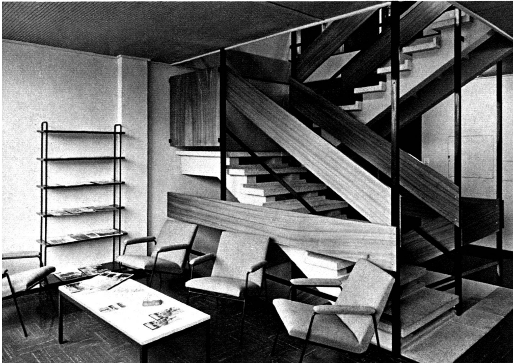
Local de réunion