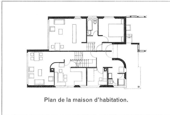
Plan de la maison d'habitation.

Cette ferme, construite dans le cadre d'un important projet de lotissement, est une entreprise familiale subventionnée. L'autorité accordant la subvention exigeait