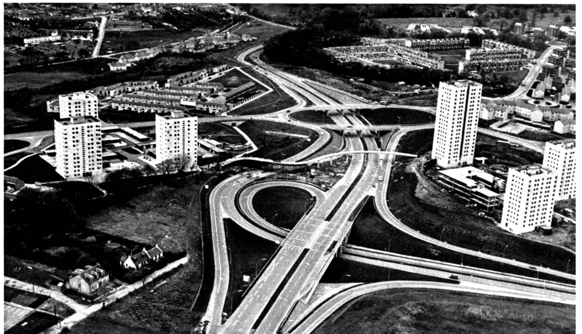
Cumbernauld, la ville la plus sûre du Royaume-Uni.