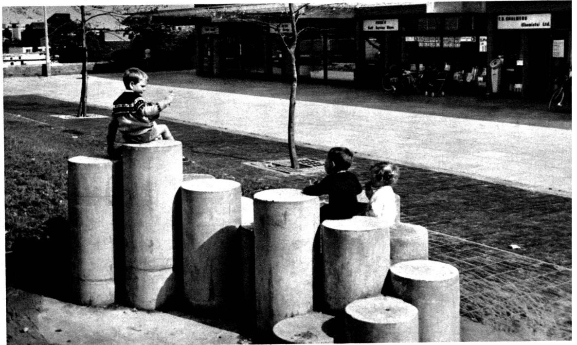
Cwmbran, la nouvelle ville galloise aux sept ponts.