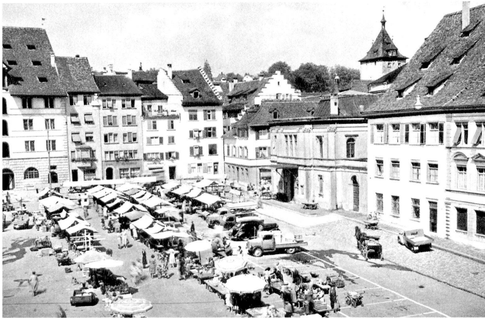
Les places qu'ont connues nos pères.