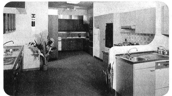
● votre cuisine

1211 Genève Grand-Pré 33-35, Tél. 022/34 80 50 1000 Lausanne Rue des Terreaux 21, Tél. 021/20 32 11 1800 Vevey Rue St-Antoine 7, Tél. 021/51 05 31 1860 Aigle Route d'Evian, Tél. 025/2 36 23 1837 Château-d'Oex Le Pré, Tél. 029/4 75 75 1400 Yverdon Rue des Uttins 29, Tél. 024/25 81 91 1951 Sion Rue de la Dixence 33, Tél. 027/22 89 31 3930 Viège Lonzastrasse, Tél. 028/48 11 41