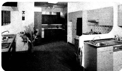
● votre cuisine

1211 Genève Grand-Pré 33-35, Tél. 022/34 80 50 1000 Lausanne Rue des Terreaux 21, Tél. 021/20 32 11 1800 Vevey Rue St-Antoine 7, Tél. 021/51 05 31 1860 Aigle Route d'Evian, Tél. 025/2 36 23 1837 Château-d'Oex Le Pré, Tél. 029/4 75 75 1400 Yverdon Rue des Uttings 29, Tél. 024/25 81 91 1951 Sion Rue de la Dixence 33, Tél. 027/22 89 31 3930 Viège Lonzastrasse, Tél. 028/48 11 41