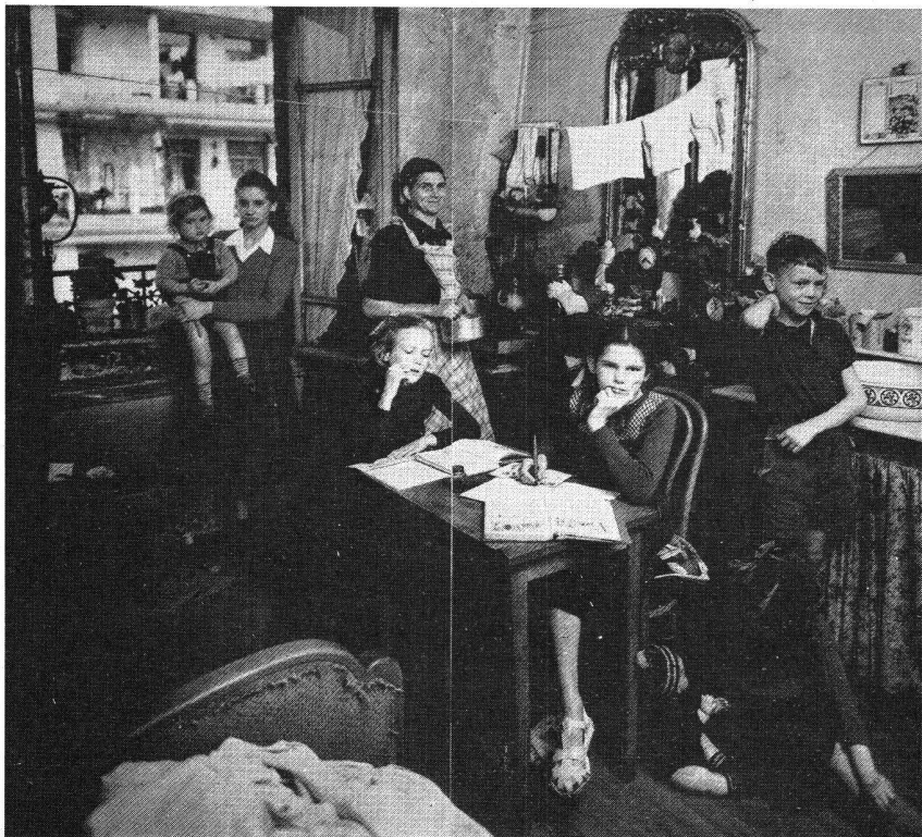
Le logement au début des « Trente glorieuses », Paris, Porte de Clichy, 1952.

une assez longue période de l'affectation du produit entre la consommation et l'accumulation, ce qui implique notamment une certaine correspondance entre la transformation des conditions de production et la transformation de celles de la reproduction de la force de travail des salariés.