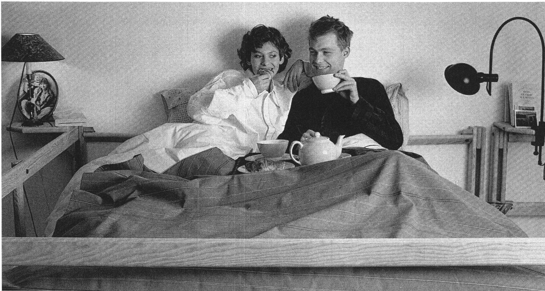
La folie des hauteurs...

les lits superposés, ce qui était déjà un progrès. La mezzanine «élimine» complètement le lit, et l'espace ainsi libéré est lui-même aménagé de manière agréable et fonctionnelle pour, véritablement, gagner de la place.