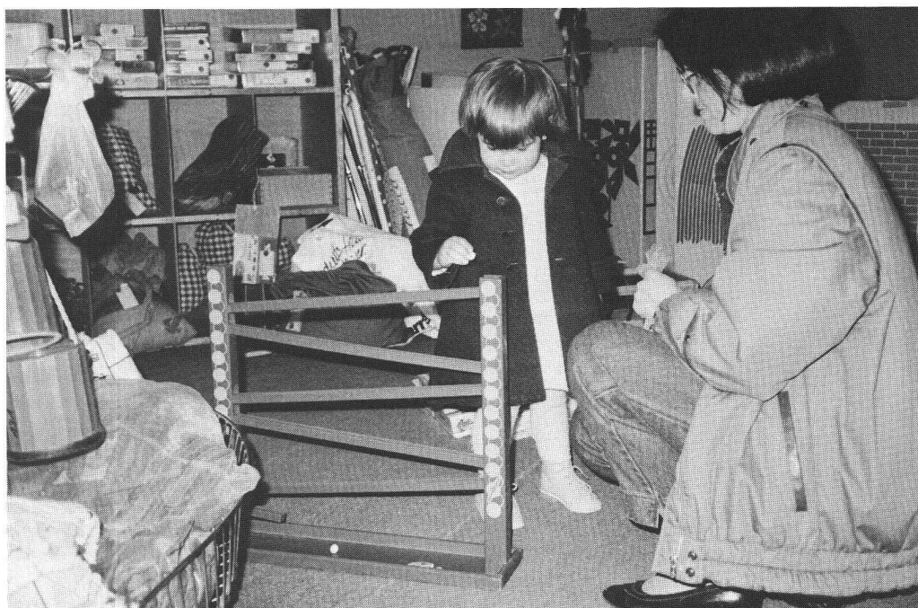
La ludothèque-antigaspi: elle met à disposition des jouets de qualité, donc onéreux.

– Un exemple. Un gosse de 8 ans a envie d'un jeu au-dessous de son âge. Parce qu'il est dans une période comme ça, il a envie de gagner à tous les coups. A la ludothèque, pas de problème, va pour un «6–8 ans». Ce qui va lui permettre de jouer «facile» quelques jours. Dans un magasin, jamais ses parents ne mettraient 20 à 30 fr. dans un tel jeu. Au contraire, ils le pousseraient plutôt à choisir un «10–12 ans», trop difficile, donc dévalorisant.