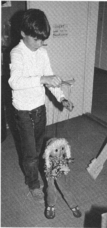
Jouer, expérimenter, choisir tranquillement.

– A la ludothèque, un petit garçon peut se passer son envie de poupée?