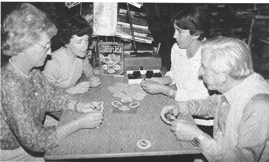
La ludothèque peut aussi être un lieu d'animation intergénérationnels.

fie... Dans ces situations, je suggère que l'enfant puisse se choisir un second jeu ou jouet pour s'amuser réellement.