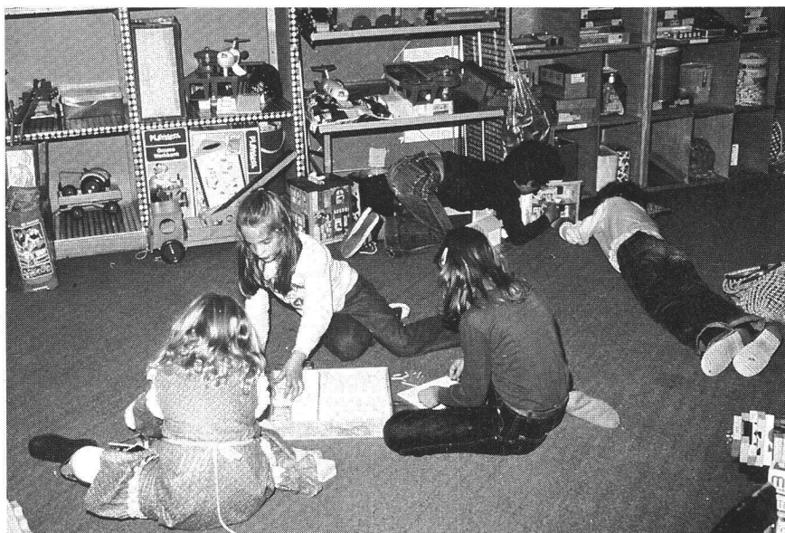
Plus de 800 nouveautés sortent chaque année sur le marché du jeu. Les ludothèques sont de plus en plus sollicitées.

Deux mille cinq cents personnes travaillent bénévolement dans les ludothèques en Suisse. Dans quelques cas, les responsables sont salariées.