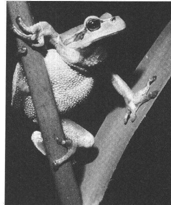
La reinette verte, en voie de disparition, retrouve des conditions de survie dans les biotopes citadins.

Il a été fait abondamment, dans la presse romande, par l'Office fédéral de la protection de l'environnement. Les chefs d'accusation: il représente 20 000 hectares de territoire cultivable, engloutit 100 tonnes d'herbicides et 10 000 à 16 000 tonnes d'engrais, mobilise des milliers de tondeuses bruyan-