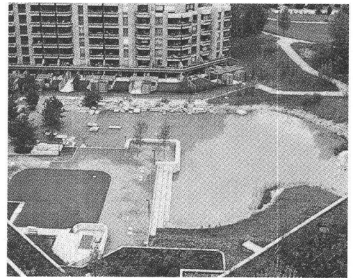
Un essai d'aménagement plus naturel.

L'adaptation des oiseaux au milieu urbain va si loin que, hirondelles de cheminées,