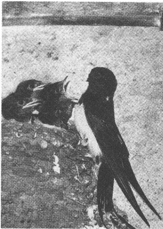
Hirondelles de cheminée.

Chaque maison et chaque jardin pourrait accueillir un coin de nature sauvage.