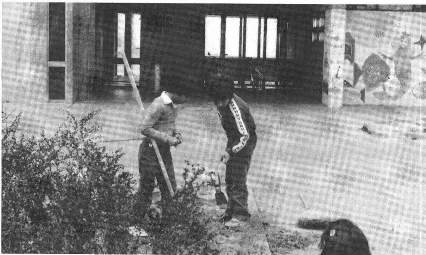
Les enfants ont besoin du contact avec la terre.

Victimes de l'«artificialisation» des cultures, les oiseaux des campagnes se raréfient. Pinsons, verdiers, chardonnerets, rouges-queues noirs, mésanges charbonnières,