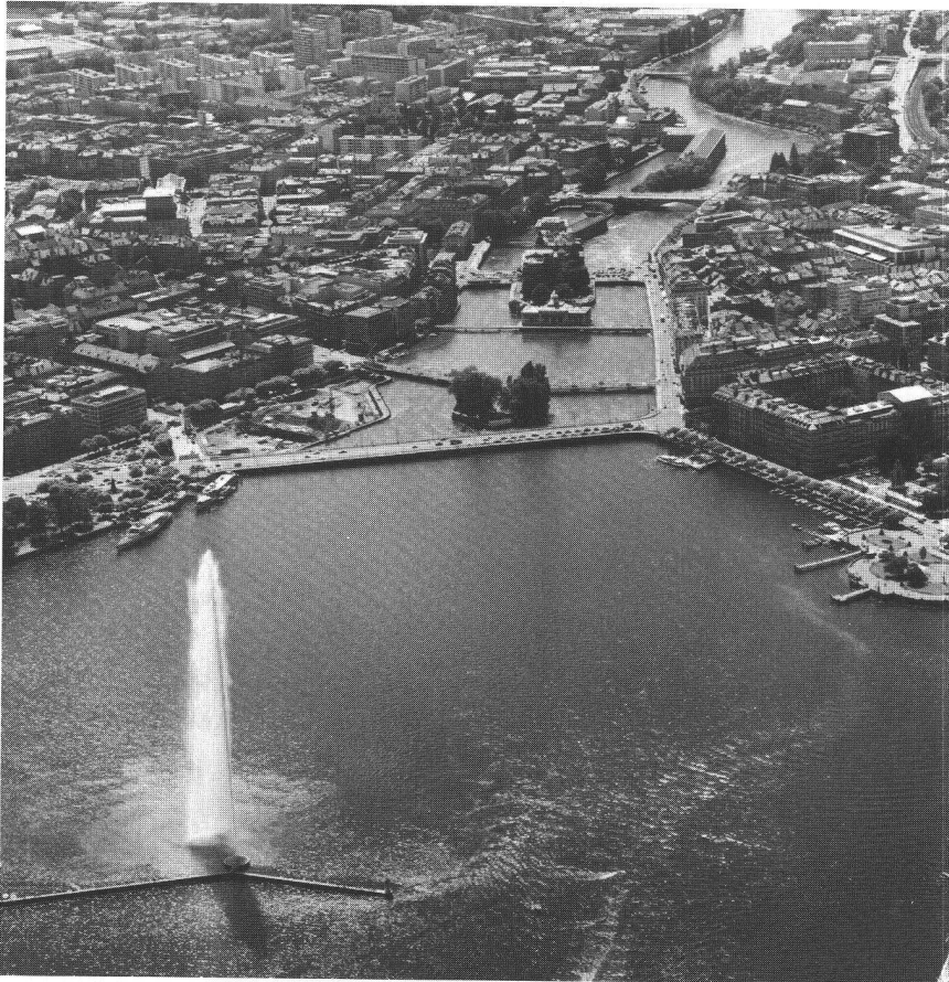
Vue aérienne de la rade et du Rhône.