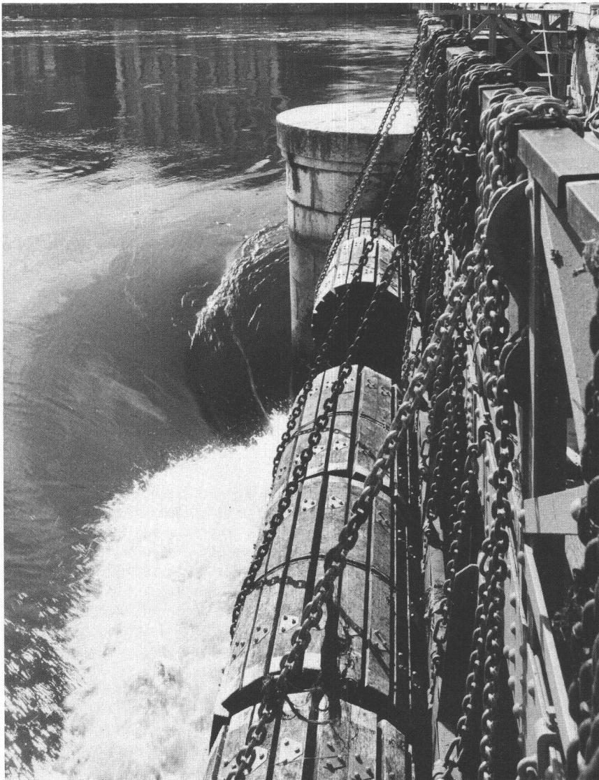
Barrage à rideaux, système Caméré, du pont de la Machine, installé dans le bras droit du Rhône en 1887. Il permet de régler le niveau des eaux du lac selon la Convention intercantonale de 1884.

La deuxième étape, au temps où Genève devenue République devait préserver son indépendance, est de nature essentiellement militaire. Elle se révèle extrêmement violente par l'importance des projets d'emprise sur le plan d'eau, la plupart heureusement non exécutés. L'exploitation du lac et du Rhône à l'intérieur du réduit de la ville passa par une crise, où s'affrontèrent les besoins de la nouvelle installation de pompage hydraulique, de l'industrie, de la salubrité, et ceux du dégagement du courant et de la régularisation du niveau du Léman. Ces exigences contradictoires entraînèrent jusqu'au milieu du XIX e siècle une rationalisation progressive dans la gestion du plan d'eau et un équilibre subtil des emprises, commandé par l'intérêt économique et les notions d'embellissement de l'espace public. La plus grande opération de comble-