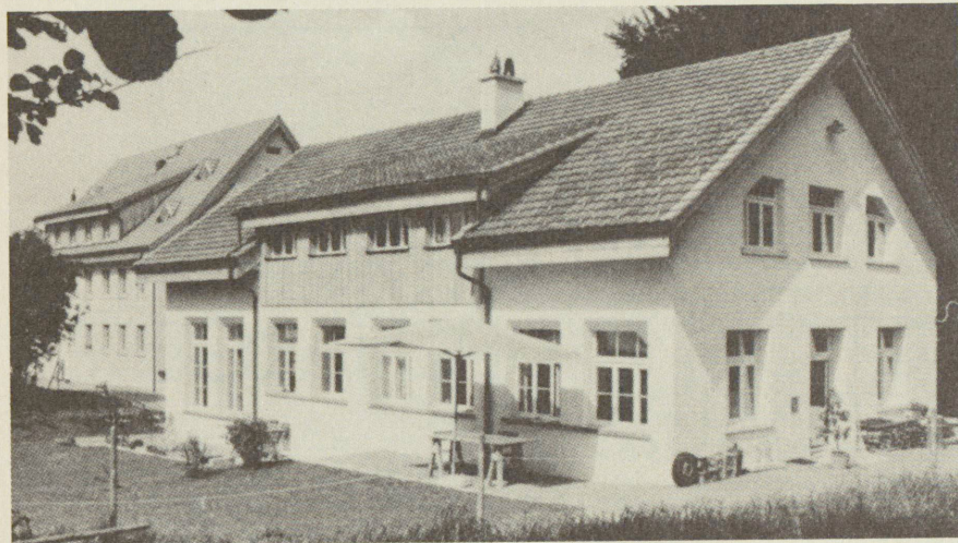
Projet Luppmen, Hittnau (ZH), 1984

Hannes Strebler, architecte HBK