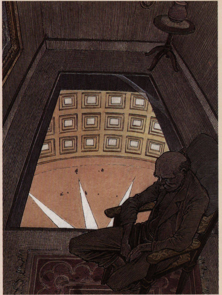
22 ème niveau Hadrien Toklas

Depuis l'appartement de M. Braunstein, la vue est déjà saisissante. Mais l'ancien receveur des postes ne semble guère d'humeur à profiter du paysage. "Bon Dieu, qu'il fait chaud ces temps-ci. Le système d'aération est déplorable... Et les odeurs ! Certains jours, monsieur, c'est proprement intolérable. Je ne sais pas ce qu'ils font, ceux d'en dessous, mais ils pourraient penser un peu à nous... Mon épouse a pris quelques semaines de repos, comme elle le fait chaque année. Moi, je ne redescends que rarement. C'est une telle expédition pour remonter."