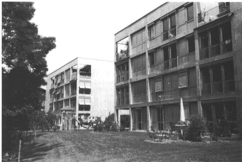
Le sud côté jardin