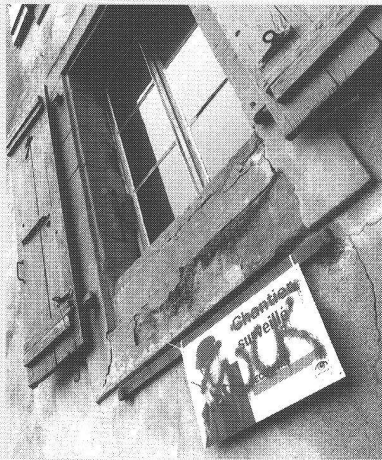
Vue plongeante sur le Désert. Il faut faire quelque chose. Mais quoi ?