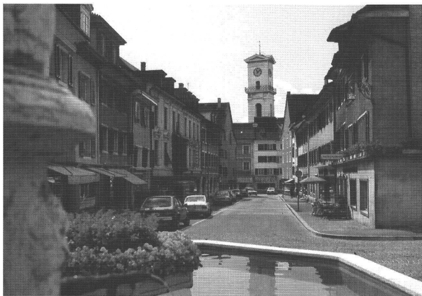
Delémont : la rue de Fer

L'effort principal de la Ville doit porter sur ce type de logements, dans la mesure où il est largement démontré que seul l'engagement résolu des pouvoirs publics, sous des formes diverses, permet d'abaisser les coûts du logement. L'utilisation systématique de l'aide fédérale au logement, multipliée par l'aide cantonale et des dispositions communales constitue l'angle d'attaque. Toutes les expériences et les simulations financières démontrent en effet que l'engagement des pouvoirs publics