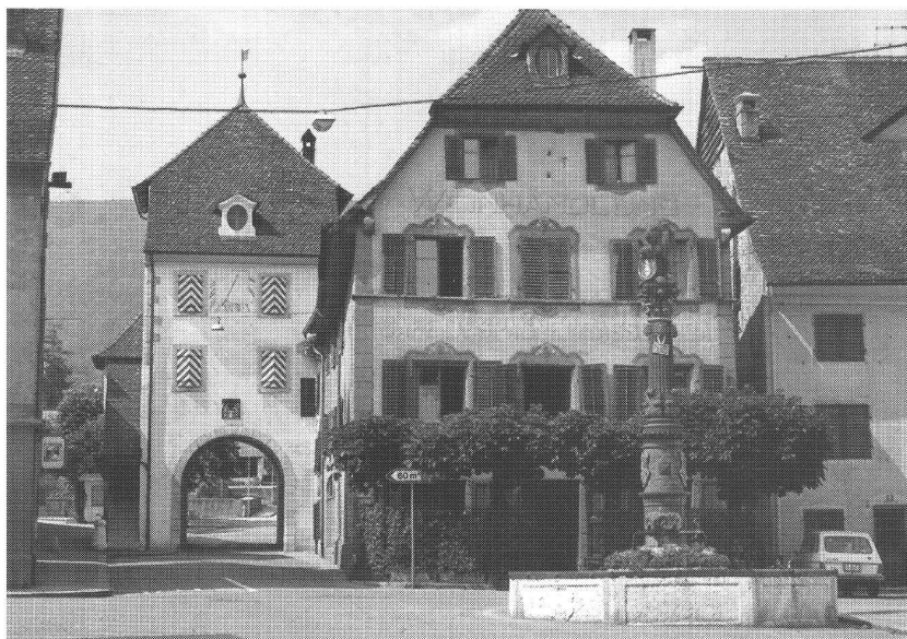
La Porte-au-Loup à Delémont

Quant au logement social, Delémont dispose d'une longue tradition, un peu oubliée avec le temps, mais réactivée à