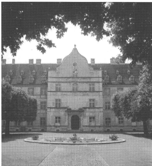
Le Château de Delémont